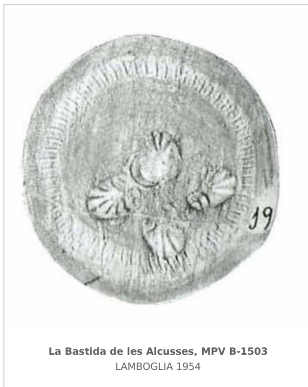
La Bastida de les Alcusses, MPV B-1503 LAMBOGLIA 1954