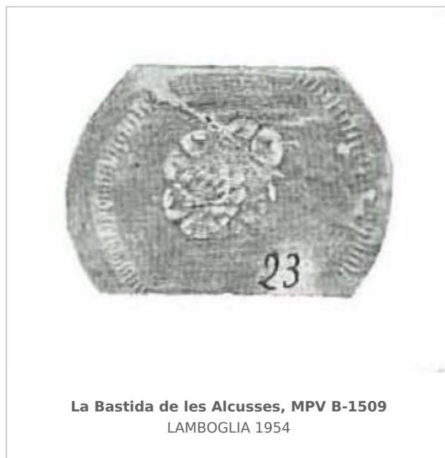
La Bastida de les Alcusses, MPV B-1509 LAMBOGLIA 1954