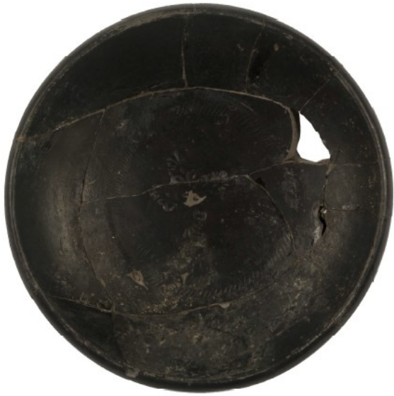
Coimbra del Barranco Ancho, MAMJM COI-NB-8581 García Cano/Gualda 2019