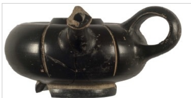
Coimbra del Barranco Ancho, MAMJM COI-NB-8585 García Cano/Gualda 2019