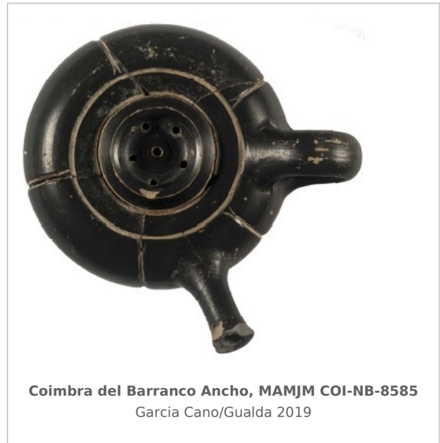
Coimbra del Barranco Ancho, MAMJM COI-NB-8585 García Cano/Gualda 2019