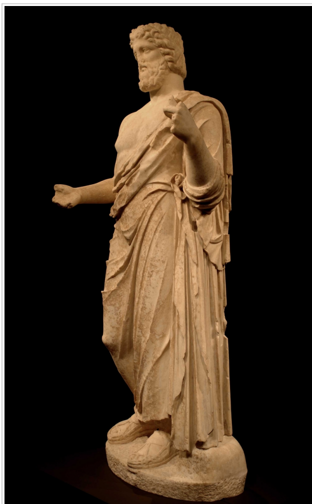
Empúries, MAC-E 2036 MAC-EMPÚRIES