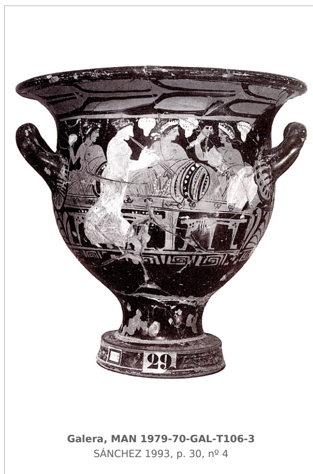
Galera, MAN 1979-70-GAL-T106-3 SÁNCHEZ 1993, p. 30, nº 4