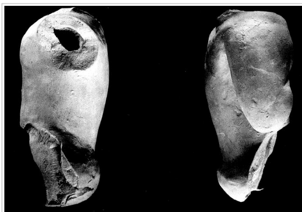
Empúries, MAC-B 845 MAC-BARCELONA (O. Clavell)