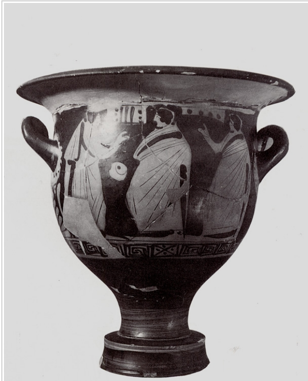
Galera, MAN 1979-70-GAL-T.83-2 SÁNCHEZ 1993, p. 31, nº 5