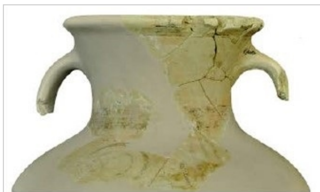
Huelva, calle Puerto 9, MH P.9/83/178-S GONZÁLEZ DE CANALES/LLOMPART 2017