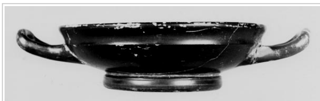
Galera, MAN 1979-70-GAL-T34-7