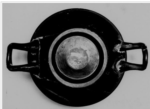
Galera, MAN 1979-70-GAL-T34-7 Foto: Museo Arqueológico Nacional