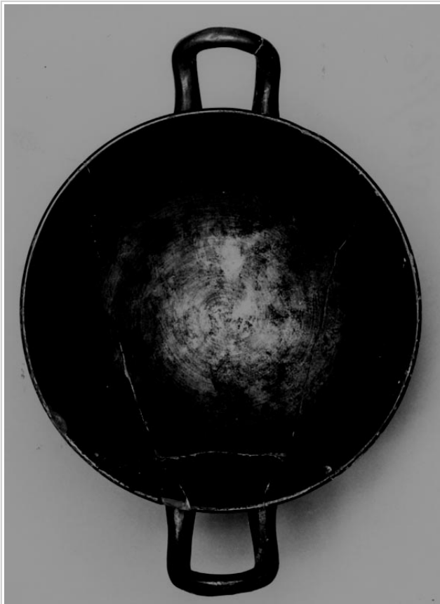
Galera, MAN 1979-70-GAL-T34-7