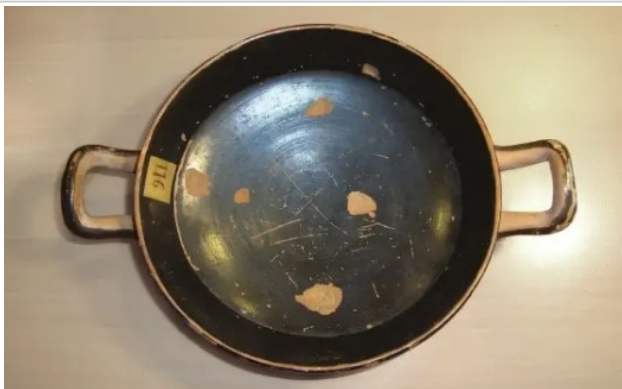
Cerro del Real. Necrópolis de Tutugi, 1979-70-GAL-T.11-3 Rodríguez/Sánchez 2017