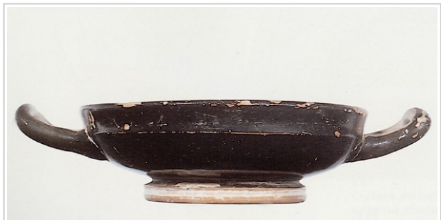
Galera, MAN 1979-70-GAL-T.11-3 SÁNCHEZ 2000b, p. 351, nº 140