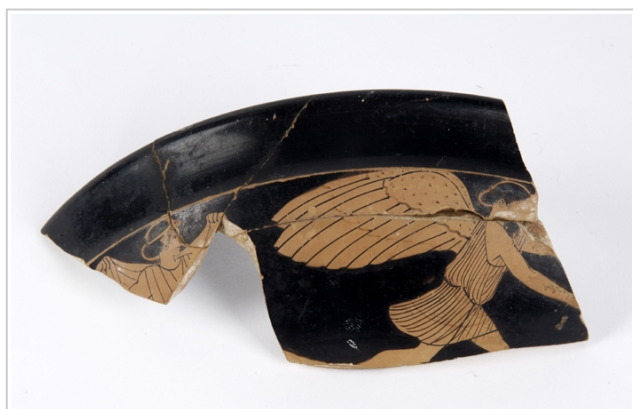
Empúries, MAC-E 1413