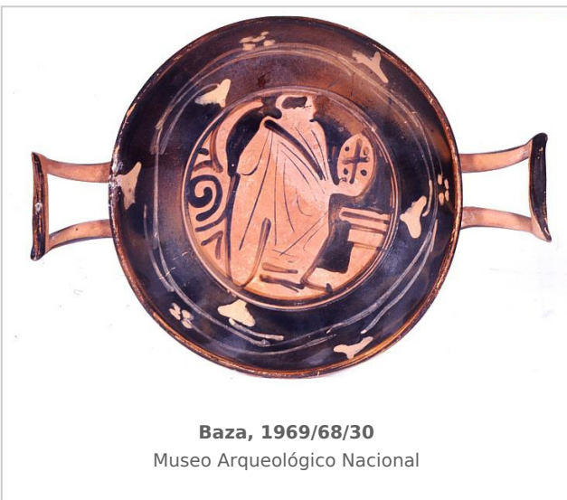
Baza, 1969/68/30 Museo Arqueológico Nacional