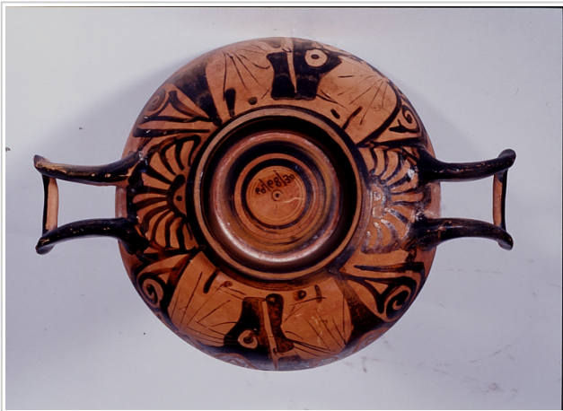
Baza, MAN 1969-68-30