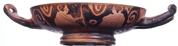
Baza, MAN 1969-68-30