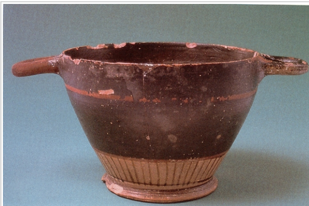
Villaricos, MUSEO DE ALMERÍA 14373 CABRERA, SÁNCHEZ (Ed.) 2000b, p. 264, nº 38