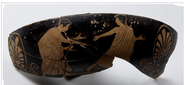
Empúries, MAC-E N-1112