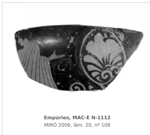
Empúries, MAC-E N-1112