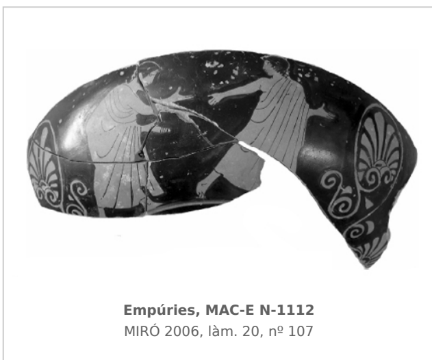
Empúries, MAC-E N-1112