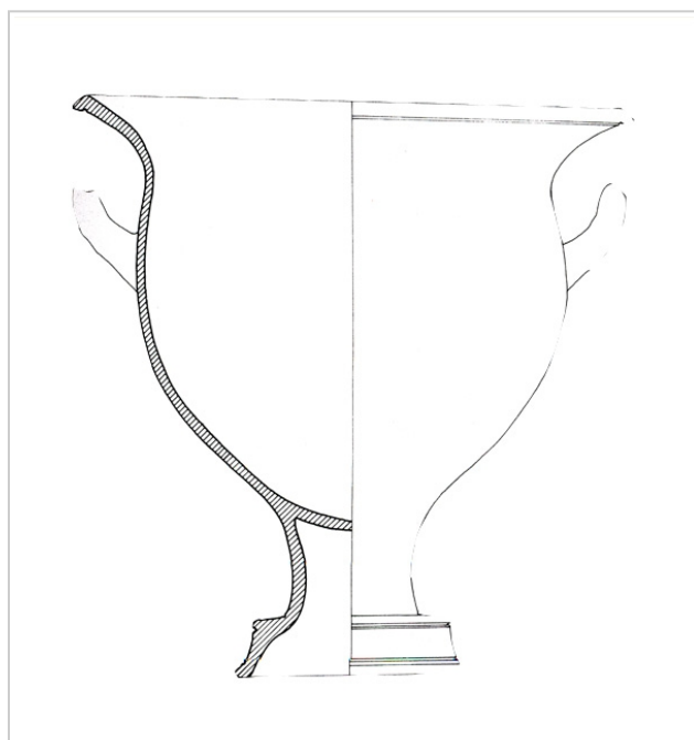
Castellones de Ceal, MUSEO PROVINCIAL DE JAÉN 140 SANCHEZ 1992b, fig. 58