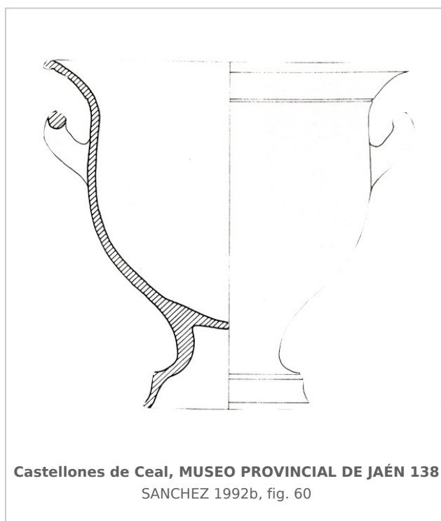
Castellones de Ceal, MUSEO PROVINCIAL DE JAÉN 138 SANCHEZ 1992b, fig. 60