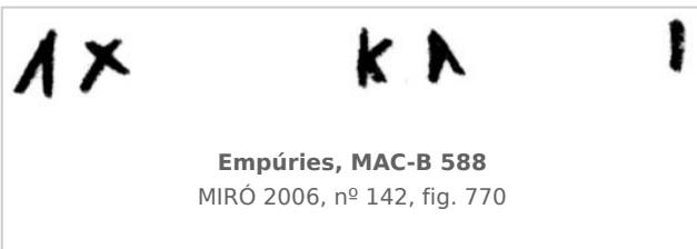
Empúries, MAC-B 588 MIRÓ 2006, nº 142, fig. 770