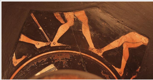
Empúries, MAC-B 588