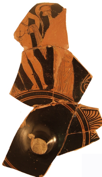
Empúries, MAC-B 505 22201