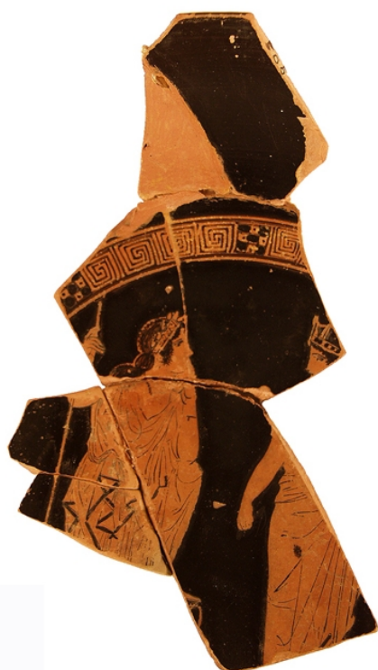
Empúries, MAC-B 505 22201