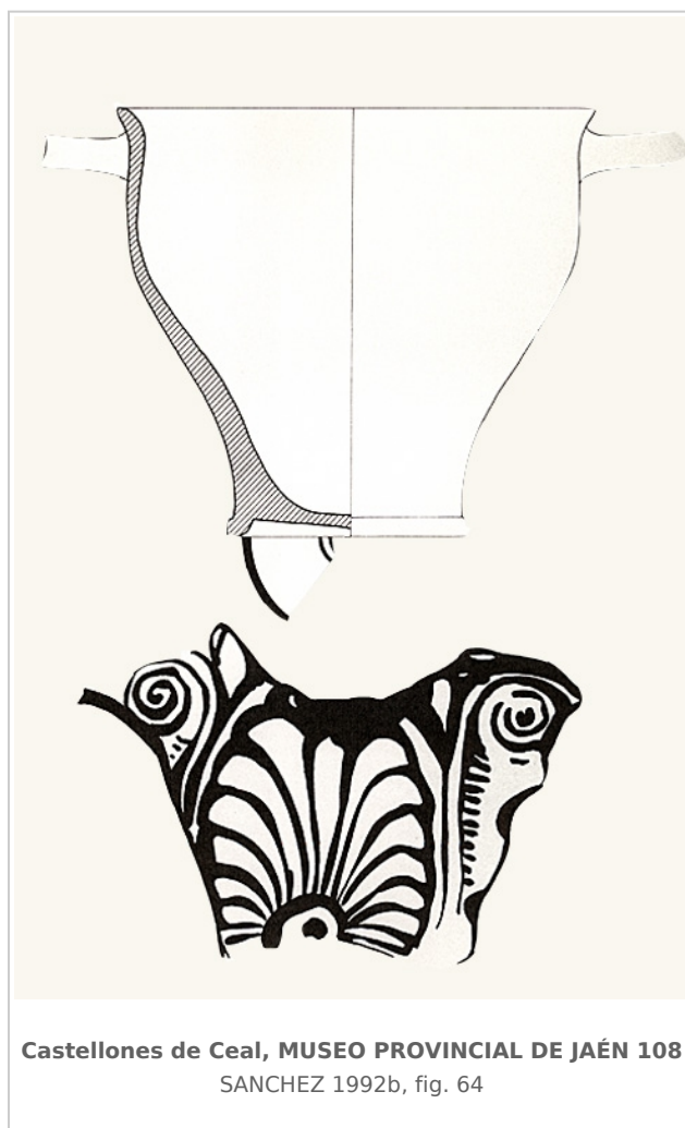
Castellones de Ceal, MUSEO PROVINCIAL DE JAÉN 108 SANCHEZ 1992b, fig. 64