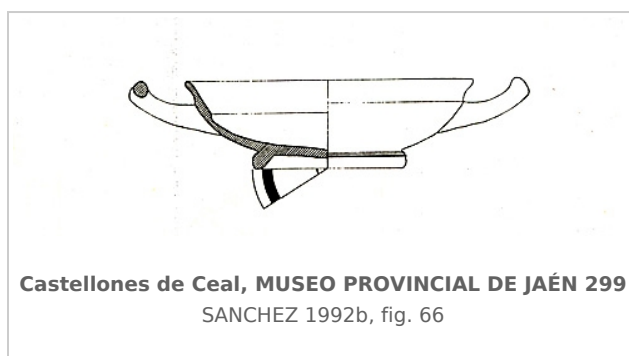
Castellones de Ceal, MUSEO PROVINCIAL DE JAÉN 299 SANCHEZ 1992b, fig. 66