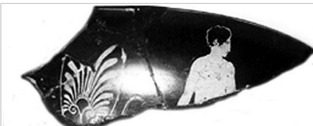
Empúries, MAC-B 583