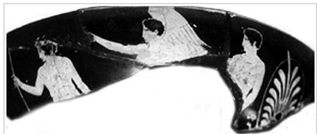
Empúries, MAC-B 583