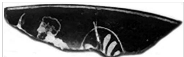
Empúries, MAC-B 583