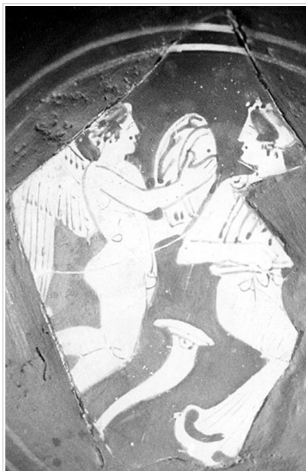
Empúries, MAC-B 613 MIRÓ 2006, p. 167, nº 731, lám. 77, 307