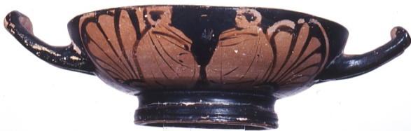
Baza, MAN 1969-68-31