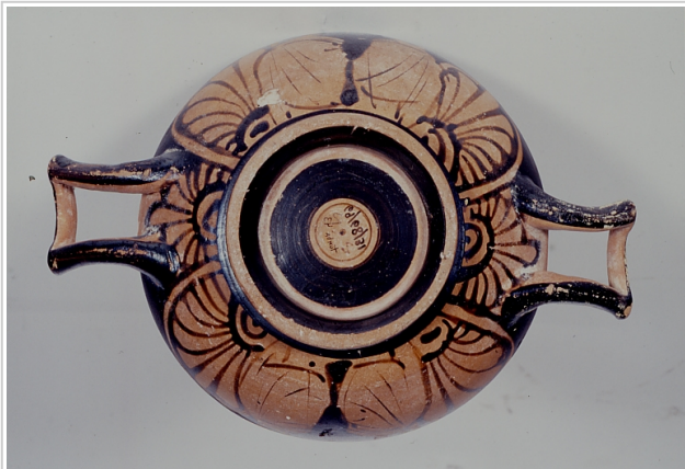
Baza, MAN 1969-68-31