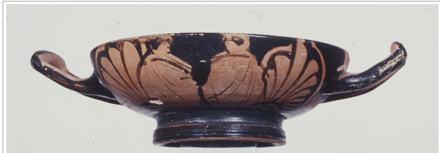
Baza, MAN 1969-68-31