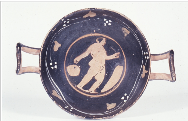
Baza, MAN 1969/68/31 Museo Arqueológico Nacional