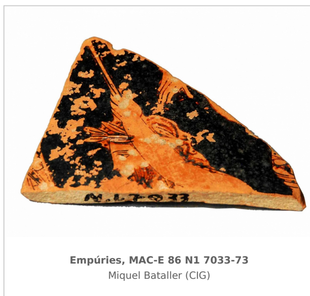
Empúries, MAC-E 86 N1 7033-73