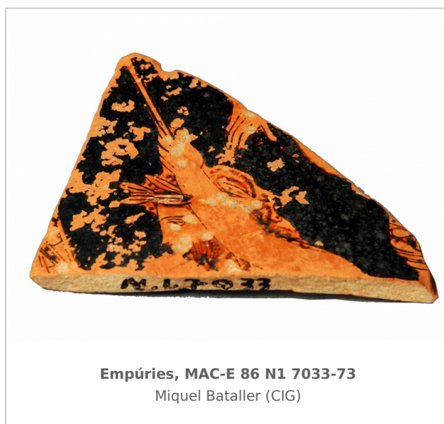
Empúries, MAC-E 86 N1 7033-73