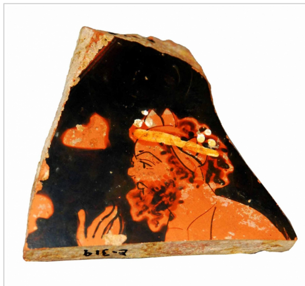
Empúries, MAC-E 85 MN 5016 1 Miquel Bataller (CIG)