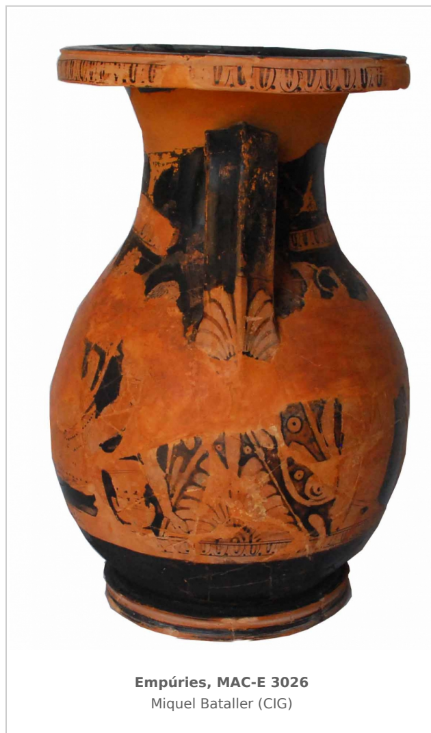
Empúries, MAC-E 3026 Miquel Bataller (CIG)