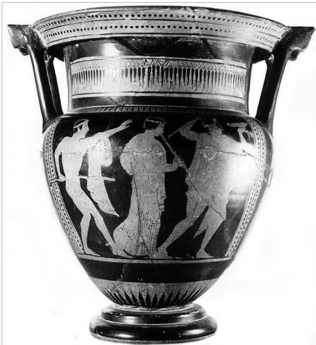
Empúries, MAC-E 265 (607 y 17) MAC-Empúries