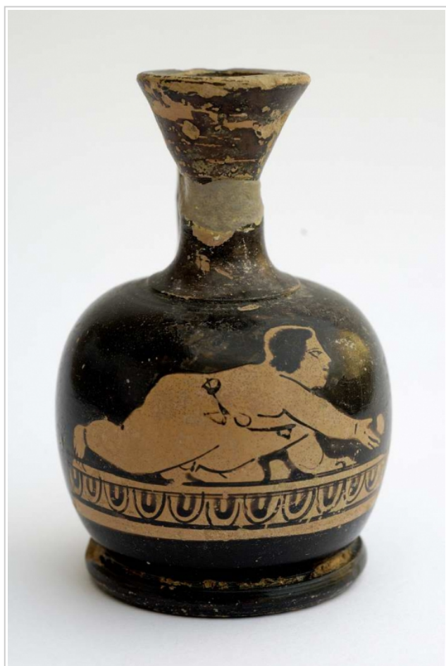
Empúries, MAC-G 21 Josep Curto, MAC-Empúries