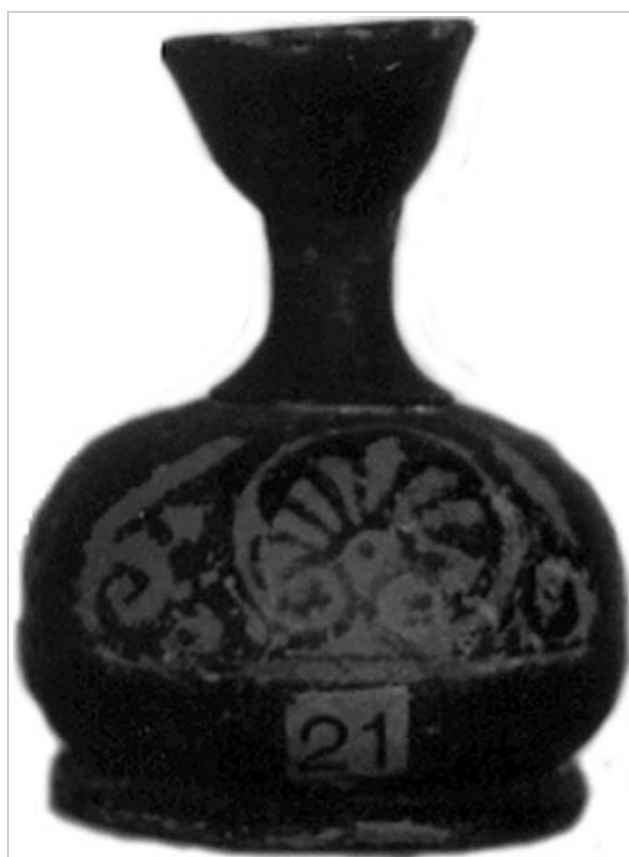
Empúries MAC-E 21-C-55, 1434 MIRÓ 2006, p. 736, nº 3588, lám. 285, 350