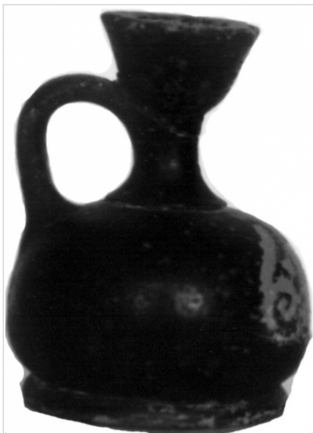
Empúries MAC-E 21-C-55, 1434 MIRÓ 2006, p. 736, nº 3588, lám. 285, 350