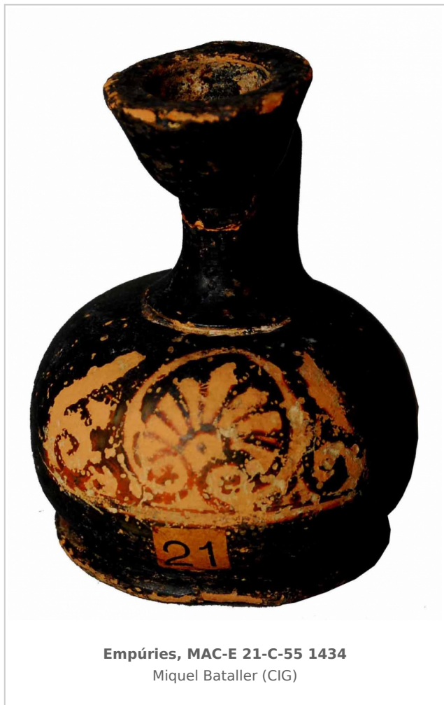
Empúries, MAC-E 21-C-55 1434 Miquel Bataller (CIG)