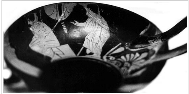
Empúries, MAC-B 617 MIRÓ 2006, p. 52, nº 187, lám. 30, 31, 304