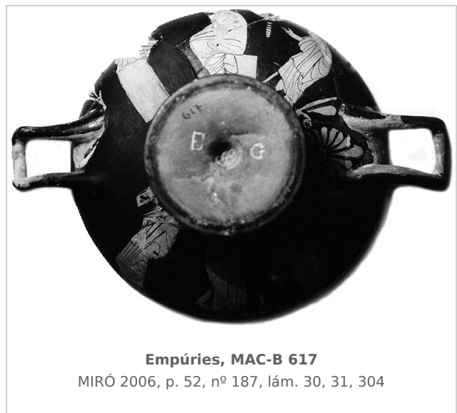
Empúries, MAC-B 617

MIRÓ 2006, p. 52, nº 187, lám. 30, 31, 304