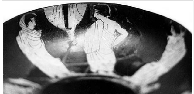
Empúries, MAC-B 617 MIRÓ 2006, p. 52, nº 187, lám. 30, 31, 304