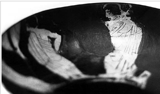
Empúries, MAC-B 617 MIRÓ 2006, p. 52, nº 187, lám. 30, 31, 304