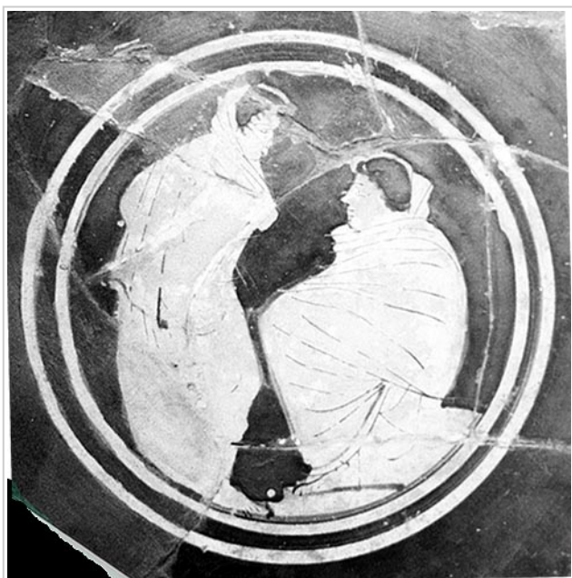
Empúries, MAC-B 617

MIRÓ 2006, p. 52, nº 187, lám. 30, 31, 304