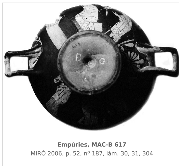
Empúries, MAC-B 617

MIRÓ 2006, p. 52, nº 187, lám. 30, 31, 304