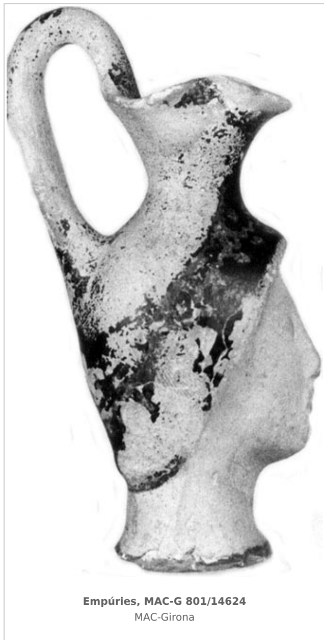
Empúries, MAC-G 801/14624 MAC-Girona