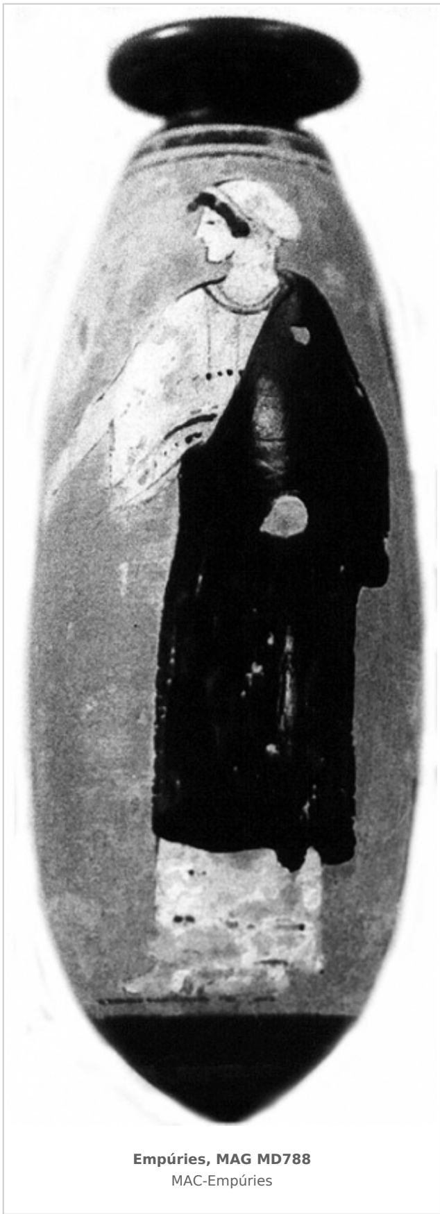
Empúries, MAG MD788 MAC-Empúries