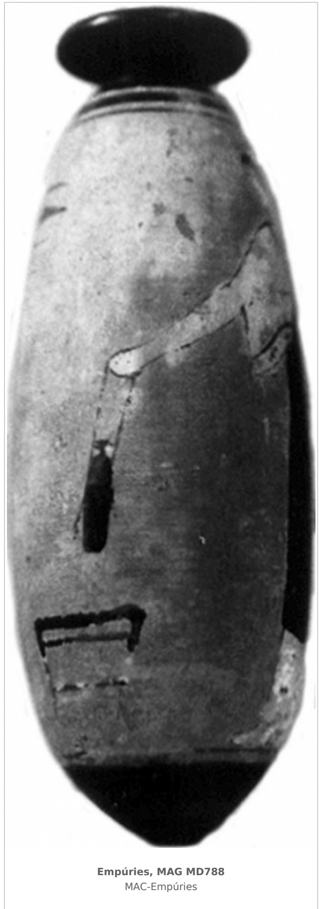
Empúries, MAG MD788 MAC-Empúries