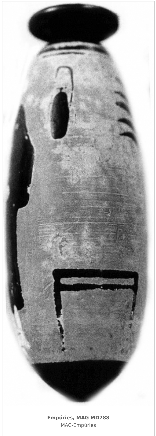
Empúries, MAG MD788 MAC-Empúries