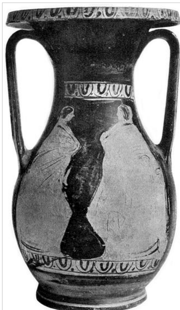
Empúries, CCA RG SN 1 MIRÓ 2006, p. 660, nº 3226, lám. 246