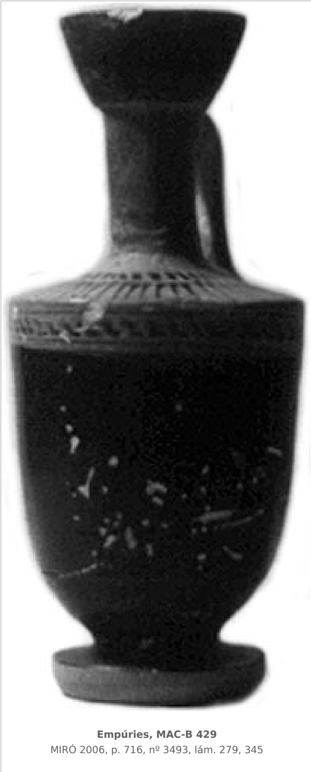
Empúries, MAC-B 429 MIRÓ 2006, p. 716, nº 3493, lám. 279, 345