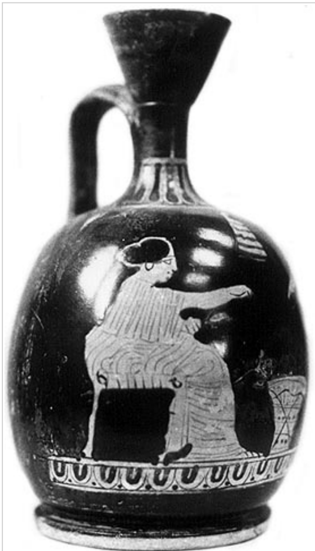
Empúries, MAG MD740

MIRÓ 2006, p. 718, nº 3505, lám. 280, 346