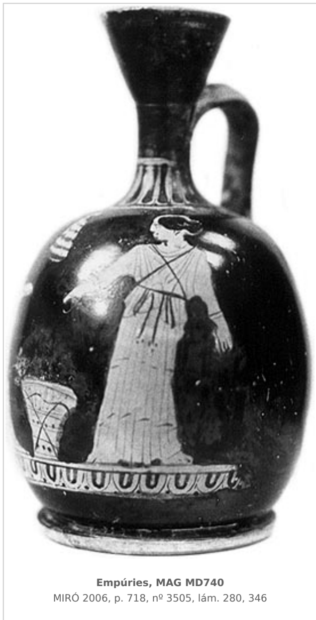
Empúries, MAG MD740

MIRÓ 2006, p. 718, nº 3505, lám. 280, 346