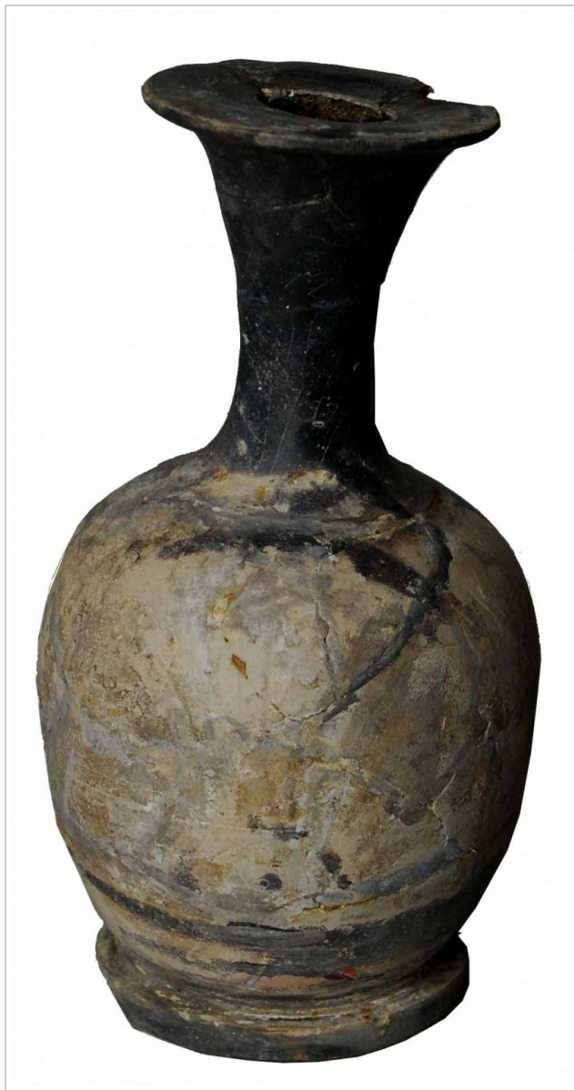
Empúries, MAC-E 1450 Miquel Bataller (CIG)