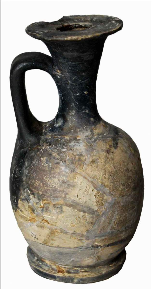
Empúries, MAC-E 1450 Miquel Bataller (CIG)