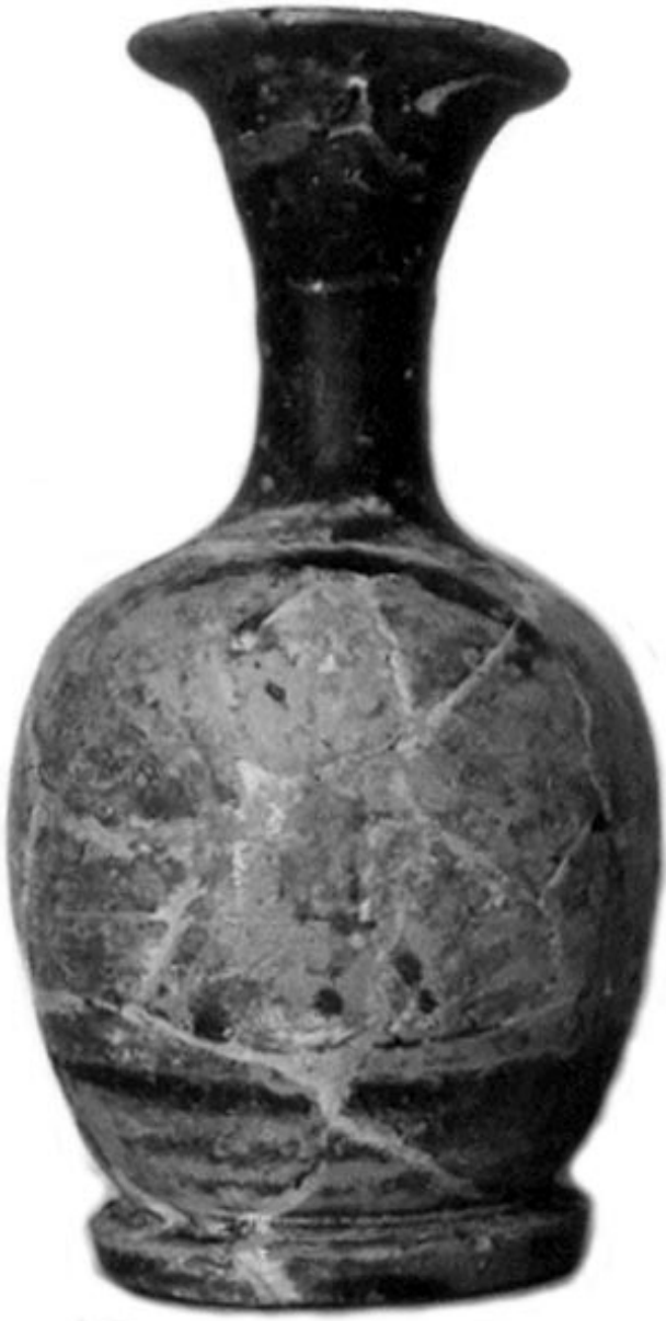
Empúries, MAC-E 1450 MIRÓ 2006, p. 727, nº 3547, lám. 287, 350