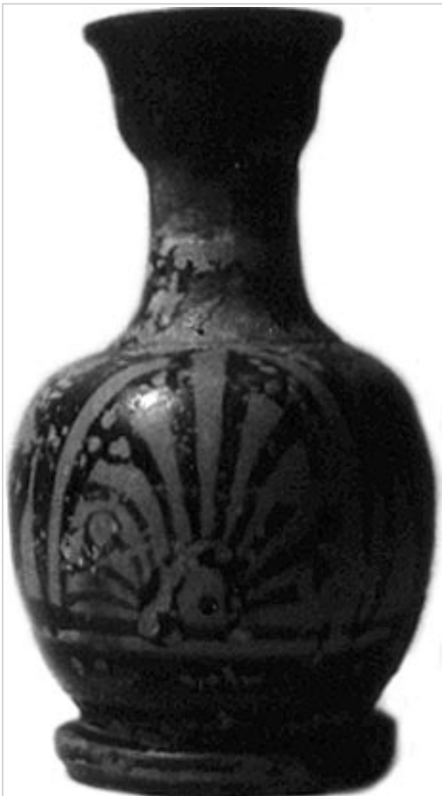
Empúries, MAG MD770

MIRÓ 2006, p. 730, nº 3561, lám. 288, 353