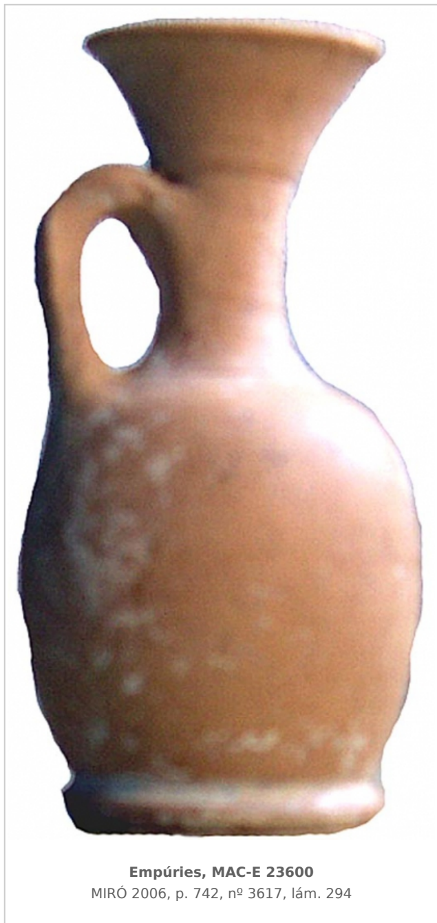
Empúries, MAC-E 23600 MIRÓ 2006, p. 742, nº 3617, lám. 294