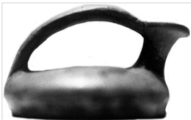
Empúries, MAC-B 603