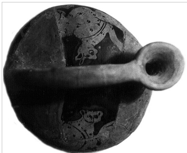
Empúries, MAC-B 603