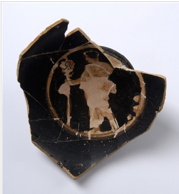
Empúries, MAC-E 700