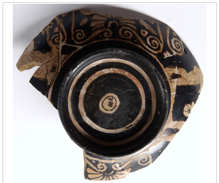
Empúries, MAC-E 700