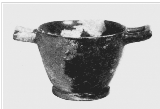
El Llano de la Consolación 3438 Trias 1967-68