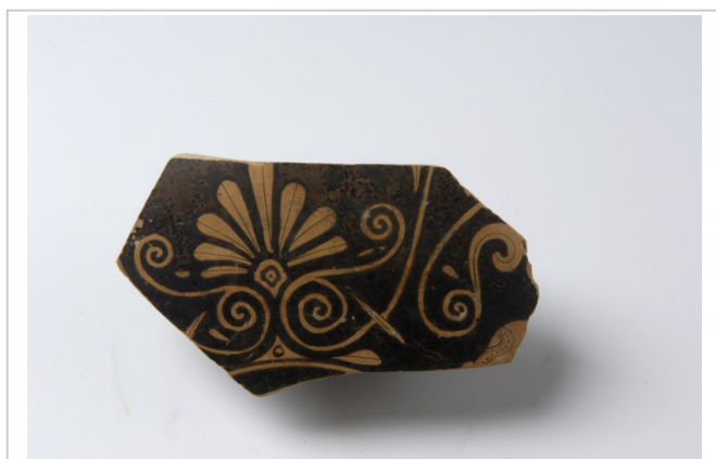
Empúries, MAC-E 22175 MIRÓ 2006