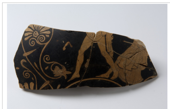
Empúries, MAC-E 22175 MIRÓ 2006, p. 191, fig. 421, p. 270, fig. 765, cat. p. 24-25, nº 79, lám. 16-17