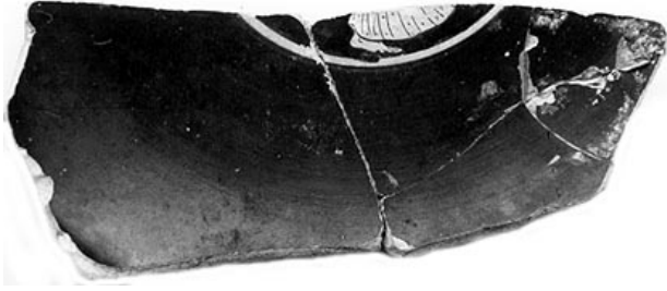
Empúries, MAC-E 22175

MIRÓ 2006, p. 191, fig. 421, p. 270, fig. 765, cat. p. 24-25, nº 79, lám. 16-17