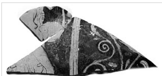
Empúries, MAC-E 22175 MIRÓ 2006, p. 191, fig. 421, p. 270, fig. 765, cat. p. 24-25, nº 79, lám. 16-17