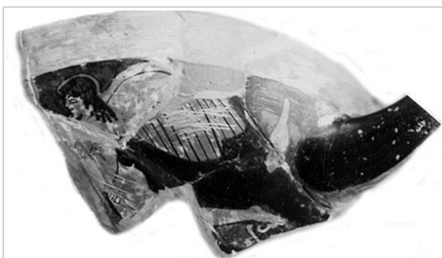
Empúries, MAC-E 1442

MIRÓ 2006, p. 185, fig. 392, cat. nº 56, p. 16, lám. 9, 10