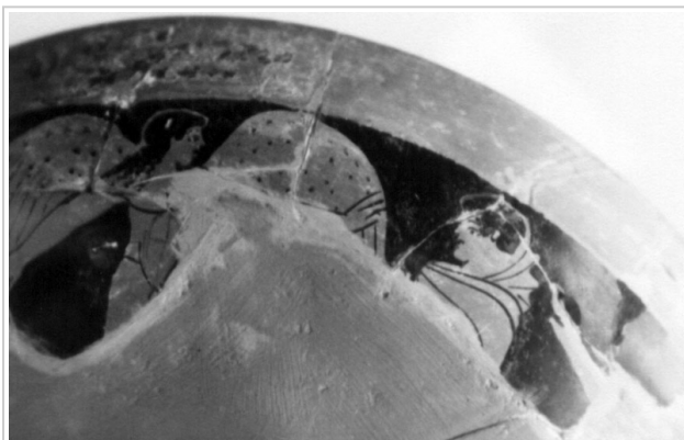
Empúries, MAC-E 1442

MIRÓ 2006, p. 185, fig. 392, cat. nº 56, p. 16, lám. 9, 10