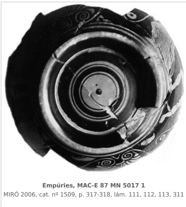
Empúries, MAC-E 87 MN 5017 1

MIRÓ 2006, cat. nº 1509, p. 317-318, lám. 111, 112, 113, 311