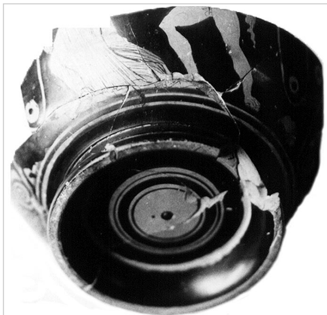
Empúries, MAC-E 87 MN 5017 1

MIRÓ 2006, cat. nº 1509, p. 317-318, lám. 111, 112, 113, 311