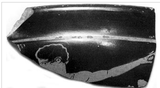
Empúries, MAC-B 519/4351

MIRÓ 2006, p. 198, p. 203, fig. 484, cat. nº 195, p. 54-55, lám. 33