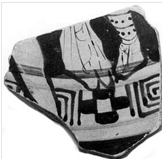
Empúries, MAC-B 4416

MIRÓ 2006, p. 223, p. 230, fig. 607, nº 583, p. 135, lám. 60