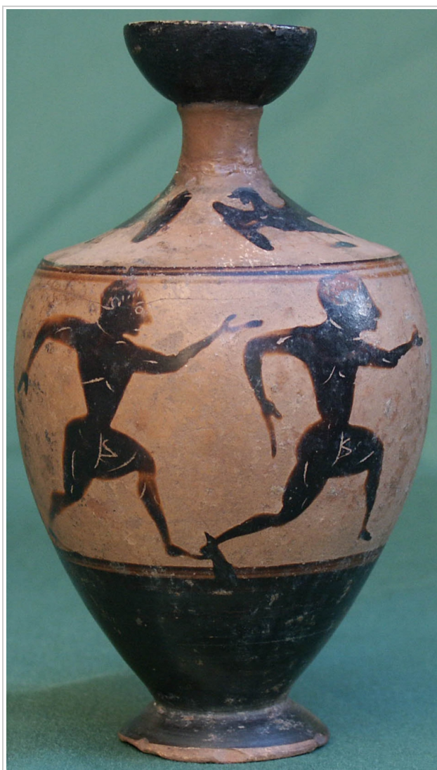
Empúries, MAC-B 412

Trias 1967-1968, p. 62, nº 101, lám. XXIII