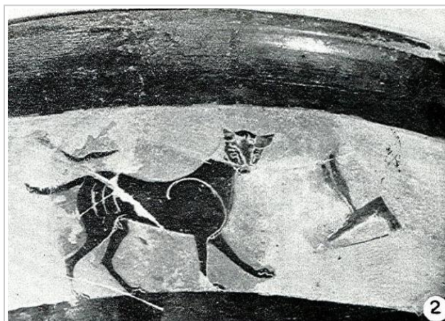
Empúries, MAC-B 415

Trias 1967-1968, p. 94, nº 227, lám. XLVIII, 1