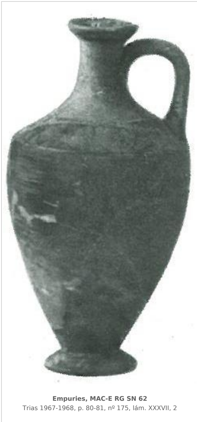
Empuries, MAC-E RG SN 62 Trias 1967-1968, p. 80-81, nº 175, lám. XXXVII, 2